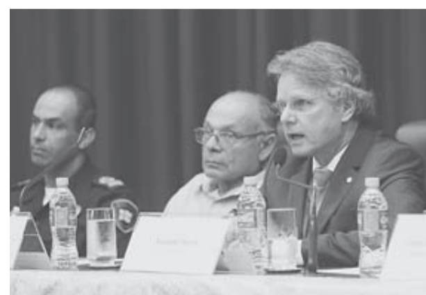
Vanderlei Macris (à dir.) participa de debate com especialistas

O 4º Encontro da Comissão do Conselho Comunitário de Segurança e Preservação da Paz e da Vida reuniu representantes das polícias Civil e Militar, da Guarda Civil Metropolitana, lideranças comunitárias, representantes dos Conselhos, das unidades de ensino e de saúde da região de Santo Amaro, além de alunos da rede estadual de ensino. O evento contou com a participação do deputado federal Vanderlei Macris (PSDB/SP), que ressaltou o trabalho conjunto da comunidade e das diversas forças responsáveis pela segurança pública na região. Pág. 3