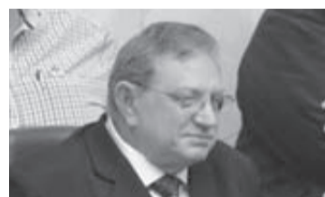
Ramalho da Construção

Em audiência pública na Assembleia paulista, comissão especial da Comissão Câmara dos Deputados promoveu debate sobre proposta para alteração do financiamento das entidades sindicais. Uma das questões